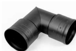
codo 45° ó 90°