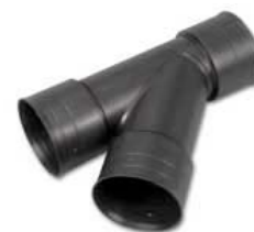
conector T 45°